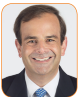
Dr. Gerhard Pfister

Conseiller national, président Neue Helvetische Bank