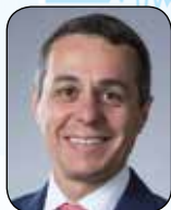
Dr. med. Ignazio Cassis Nationalrat