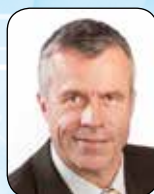
Lorenz Hess Nationalrat