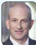
Fabian Vaucher Präsident pharmaSuisse