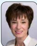
Ruth Humbel Nationalrätin