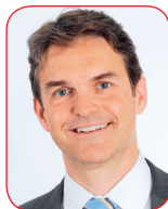
Dr. Beat Walti conseiller national, président du groupe PLR Suisse