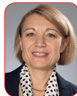
Yvonne Feri conseillère nationale, propriétaire «FERI Mit-Wirkung»