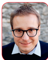
Dr. Philippe Nantermod conseiller national, avocat