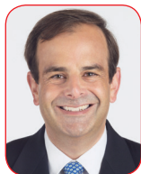
Dr. Gerhard Pfister conseiller national, président PDC Suisse