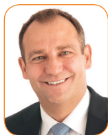
Nationalrat Thomas Matter Präsident Neue Helvetische Bank