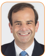
Nationalrat Dr. Gerhard Pfister Präsident CVP Schweiz