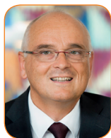
Regierungsrat Pierre Alain Schnegg Gesundheitsdirektor des Kantons Bern