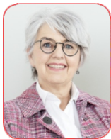
Elisabeth Baume-Schneider Conseillère fédérale Département fédéral de l'intérieur DFI