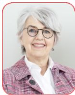
Elisabeth Baume-Schneider Bundesrätin Eidgenössisches Departement des Innern EDI