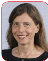
Dr. Bettina Balmer Nationalrätin