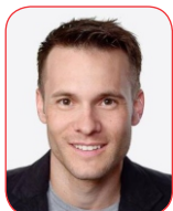
Patrick Hässig Nationalrat